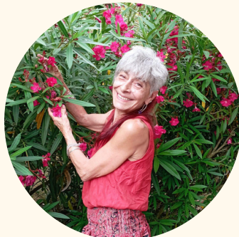
Coco tout en vrac