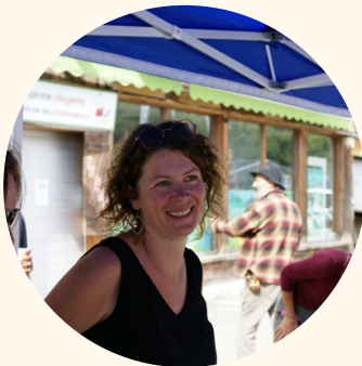
Manue celle qui compte