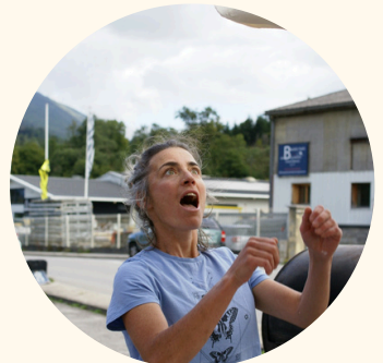
Clarisse la force tranquille - mais démissionnaire