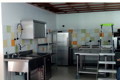
14 décembre - ça y est la cuisine est posée !

RDV LE 14 JANVIER POUR DECOUVRIR NOTRE NOUVEL ESPACE !